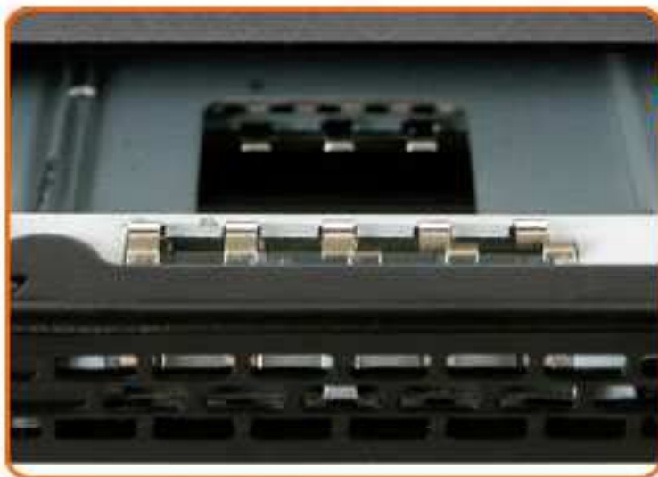
EMI GROUNDING + DESIGN ANTI-VIBRATION