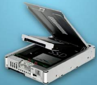
EZConvert Pro MB982SPR-2S R1