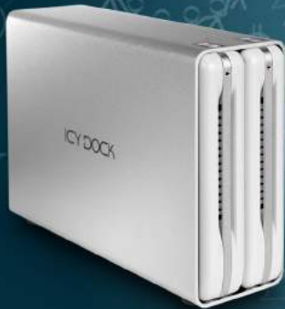
ICY RAID MB662U3-2S R1